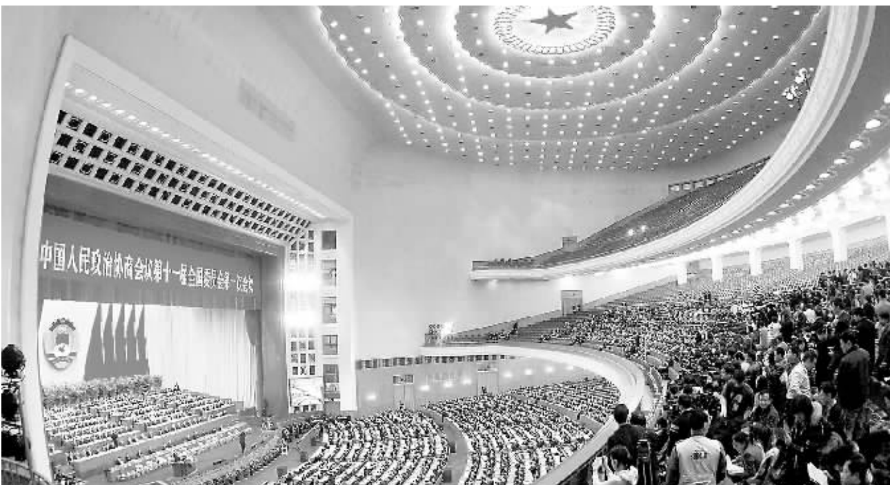
3月3日,全国政协十一届一次会议在京开幕。