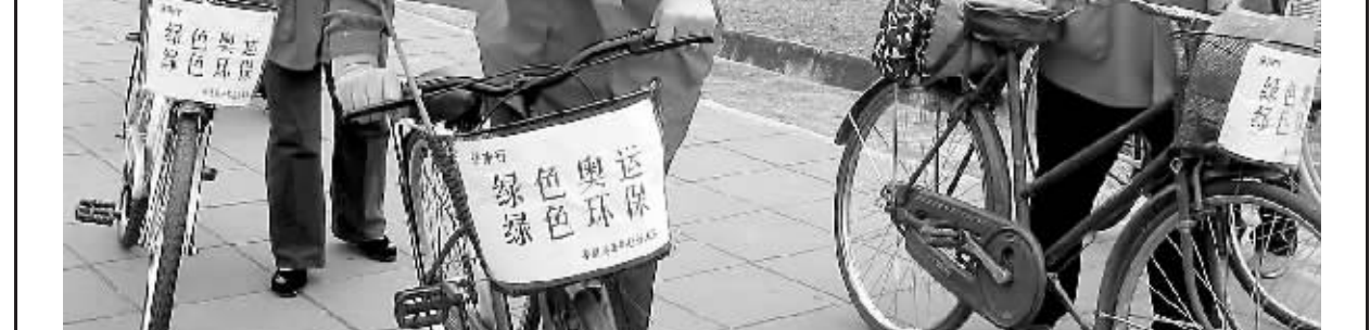
河北老人骑游海南迎奥运

海博格透露,他曾经将在三亚建设奥林匹克国际村的设想与一些专业体育协会的负责人进行了交流,结果大家都对此非常感兴趣。大家都认为,这个项目将给三亚未来的发展带来巨大的机会,奥林匹克国际村也将成为世界上最好的运动中心之一。