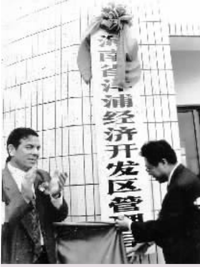
1993年4月10日，洋浦经济开发区管理局正式成立，代表海南行使对开发区和附近海域的行政管理权。