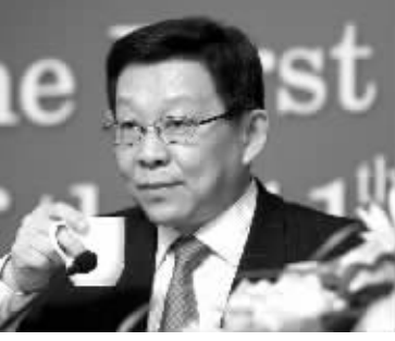
3月12日下午，商务部部长陈德铭在北京梅地亚中心多功能厅，接受中外记者集体采访。

第三是政策上有调整 and 变化。去 年年底以前，外商投资企业在华赚的 利润在中国再投资的话，是可以返