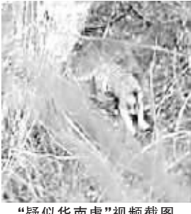
“疑似华南虎”视频截图

记者了解到，24日下午，岳阳市派出督查组赶赴平江县专门督办。截至24日晚，平江县联合调查组对参与此事的有关人员开展了调查谈话。对马戏团的老虎为什么会出现在拍摄现场等有关情况，联合调查组正在进一步调查。