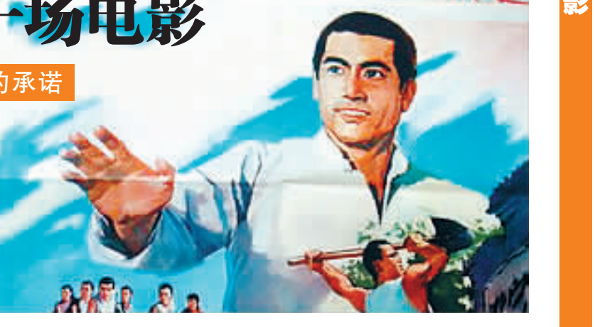
电影院线已经成功组建 57 支流动放映队伍,平均每个市县拥有 32 个放映队,放映员达到 160 人,一方面安置了大部分市县电影公司的下岗人员,另一方面壮大了企业,激发了员工的积极性。

省电影公司作为我省电影业的领头兵,改变农村电影市场的窘境责无旁贷。经多方协商,由省电影公司牵头,成立了海南省农村数字电影院线有限责任公司,专门扩展农村电影市场。“没技术,我们出资 100 万元负责安排学习,没设备,我们出资 200 万元配置。”陈亚冠说,截至目前,农村数字