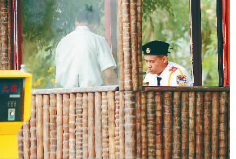
4月1日,三亚湾嘉和海景国际公馆门岗,新老物业服务公司各派一名保安值班。

本报三亚4月1日电 (记者张隼星) 今天是嘉和海景国际公馆新物业服务公司合约正式生效的第一天。但当业主们张罗着交接时,却发现虽然新物业已经进驻,但原物业公司仍继续“坚守”岗位,两家物业公司的工作人员竟同时在一个小区“上岗”。