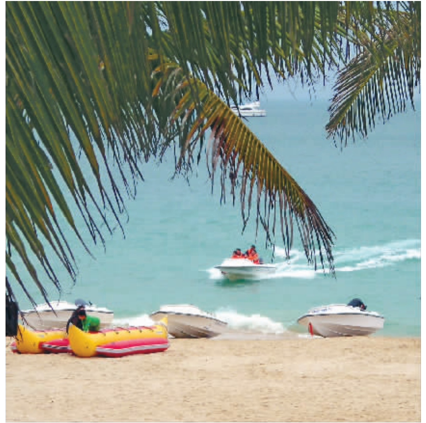
三亚美景,引豪华酒店纷落户。

昨晚,世界知名豪华酒店联盟——美国“首选”酒店集团(Preferred Hotel Group)在亚龙湾举行了一场特殊的加盟签约仪式,三亚爱琴海岸康年套房度假酒店正式成为世界600多家豪华酒店联盟中的一员。