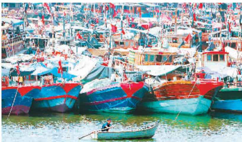
受“浣熊”的影响,昨天,三亚在外作业的渔船纷纷返回三亚港避风。

本报海口4月16日讯(记者卓上雄 特约记者赵惠忠 通讯员熊璇)“现在就有台风?没弄错吧?”今天,对今年第1号台风“浣熊”已在南海生成并将于最近两天严重影响我省的消息,感到非常意外的大有人在。