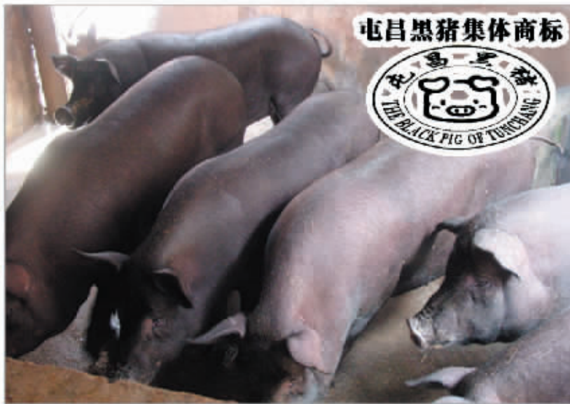
屯昌黑猪集体商标

屯昌加速发展的战略机遇期即将到来,一个粮丰林茂、山清水秀、社会和谐、人民富裕的新屯昌即将展现在世人面前。