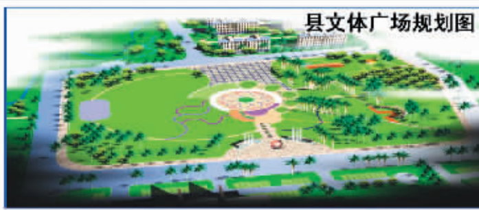
县文体广场规划图