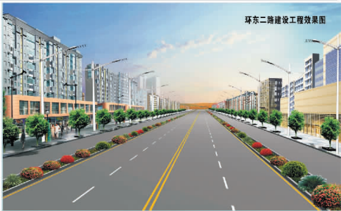
环东二路建设工程效果图