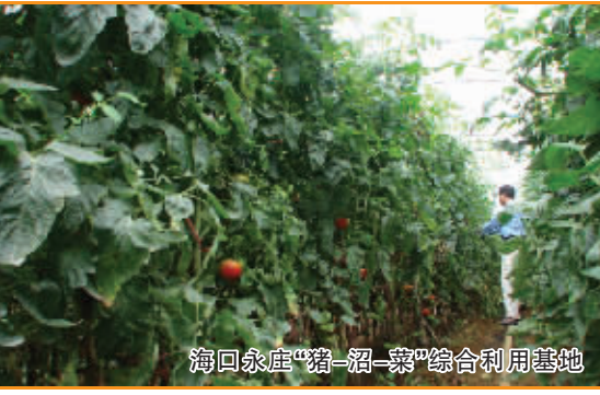
海口永庄“猪—沼—菜”综合利用基地