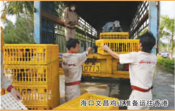
海口文昌鸡正准备运往香港