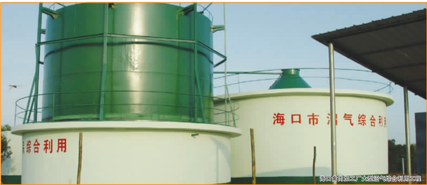
海口禽肉加工厂大型沼气综合利用工程

为进一步提高都市农业生产组织化程度,海口市已培育国家级、省级农业龙头企业17家,帮带和引领2.9万户农民进入产业化经营领域。去年海口市引导龙头企业、农村能以资金、技术、品牌和市场运销参与农民专业合作社,带动农民发展特色农业。2007年全市成立合作社128家,占全省的50%,采取“龙头企业+合作社+农民”模式,共创建了10个畜禽标准化养殖小区、18个大中型沼气池、1.5万亩生态循环农业基地和1万多亩果