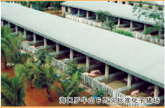
海口罗牛山6万头标准化养猪场