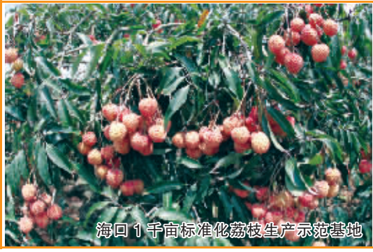
海口1千亩标准化荔枝生产示范基地