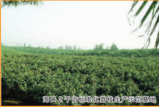
海口2千亩标准化荔枝生产示范基地