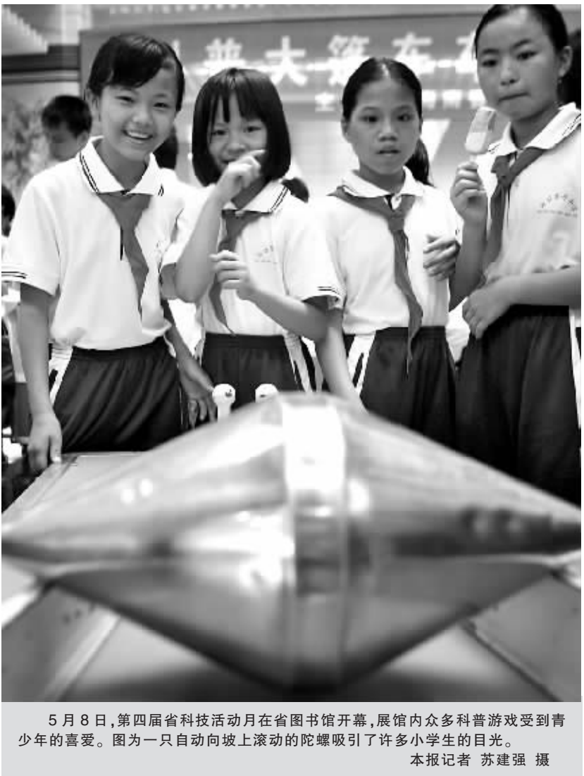
5月8日,第四届省科技活动月在省图书馆开幕,展馆内众多科普游戏受到青少年的喜爱。图为一只自动向坡上滚动的陀螺吸引了许多小学生的目光。

在今天的开幕式上,还举办了“科技与民生”大型科普图片展,展出了最新的节能减排技术、农业生产科学技术、农业新品种以及防震减灾科普知识等上千幅科普图片,科技大篷车也开进了省图书馆,向我省公众展示了25件车载科技产品,以直观、互动的方式生动有趣地介绍了“拓扑”、“勾股定理”等一些科学原理。