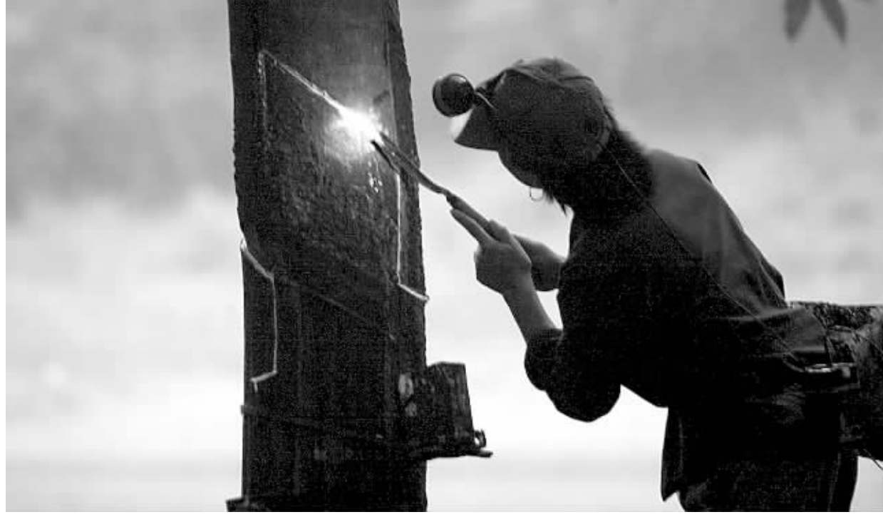
长期承包,让农垦胶工看到收入增加的阳光。

半年的试验证明,“定量上缴、超产归己”模式效果明显,各试点队职工最多的增收7000多元,最少的也增收4000多元。