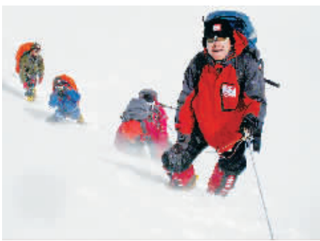
登山队队员在海拔7000米处行进。