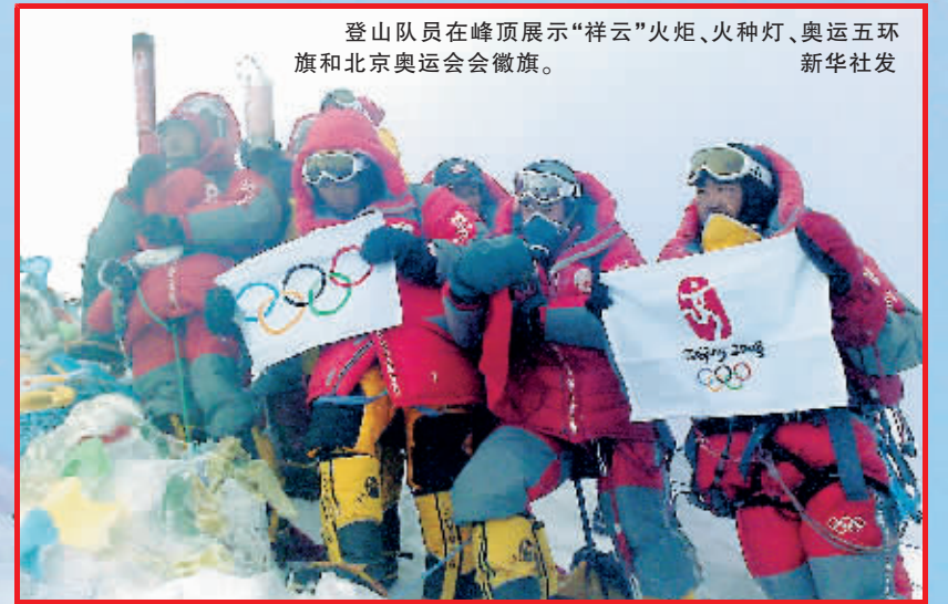
登山队员在峰顶展示“祥云”火炬、火种、奥运五环旗和北京奥运会会旗。