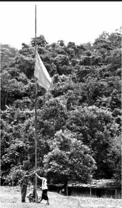
↑5月19日,五指山保护区护林员王国东、王友强、王享柳以特有方式降半旗,向地震死难者志哀。