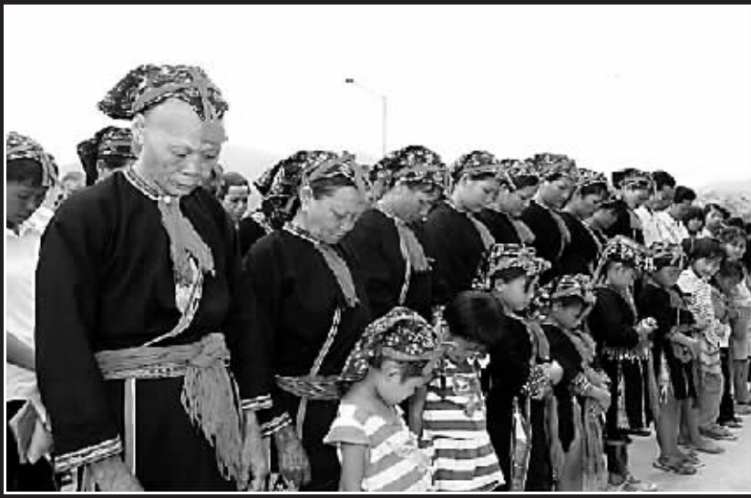
↑琼中黎族苗族自治县长征镇烟园村,苗族群众为地震遇难者默哀。

哭吧,你要挺住 如果你想哭 你就哭 别忘了悲伤也能化为支柱 如果你想哭 你就哭 我们一定会跨过这坎坷的路 痛快地哭吧 但是 朋友 请你一定要挺住