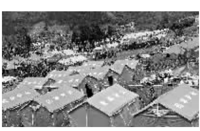
这是5月19日拍摄的四川省绵竹市黄金镇的救灾帐篷。