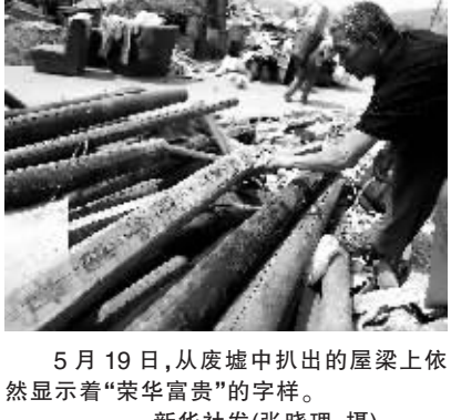
5月19日,从废墟中扒出的屋梁上依然显示着“荣华富贵”的字样。