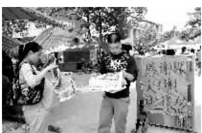
5月19日,四川省绵竹市土门镇的两位受灾群众在路边看报纸,了解赈灾情况。