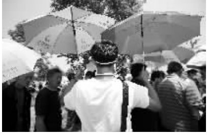
5月19日,一名志愿者打着两把伞为排队吃饭的受灾群众遮挡阳光。