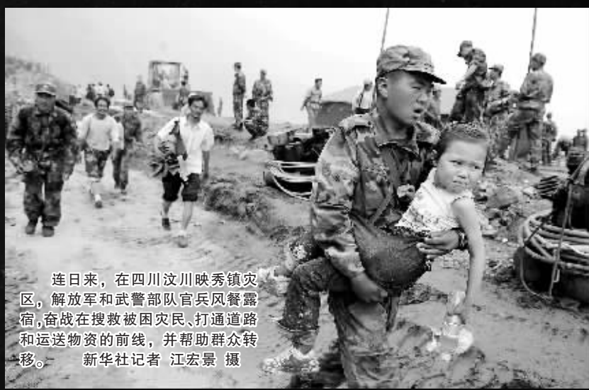
连日来,在四川汶川映秀镇灾区,解放军和武警部队官兵风餐露宿,奋战在搜救被困灾民、打通道路和运送物资的前线,并帮助群众转移。

第十三版 2008年5月20日 星期二 时事部主编 值班主任/王蜀生 主编/杨帆 美编/林海春