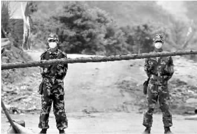
图为武警官兵和警察在通往北川县城的道路上设置警戒点,所有人员均不得进入县城。

本报四川北川5月20日电(海南援川救灾特派记者李英挺)由于余震和几处堰塞湖汛情警报没有解除,北川老城区和新城区的救援今天被迫中断。 上午,在四川北川羌族自治县,武警官兵和警察在通往北川县城的道路上设置警戒点,所有人员均不得进入县城。 据警戒人员介绍,根据预报,20日至22日,四川汶川、北川、理县、茂县、绵竹、安县等重灾区将有中到大雨,降雨天气将对四川地震灾区的救灾工作和灾区群众生活造成不利影响。有关部门需密切关注堰塞湖水情变化及地质灾害发生的可能性。封城主要是防止疫情的发生,防范余震和降雨产生的各种危险。据悉,县城旁边有一个山体已开始渗水。 为了确保救援人员的安全,指挥部今天决定城区救援行动临时中断一到两天。 北川县抗震救灾指挥部决定,今天开始进一步加强对外村的救援力度。目前北川县所有乡村都有救援人员进入。有一个乡叫悬坪乡,有几百个群众被困