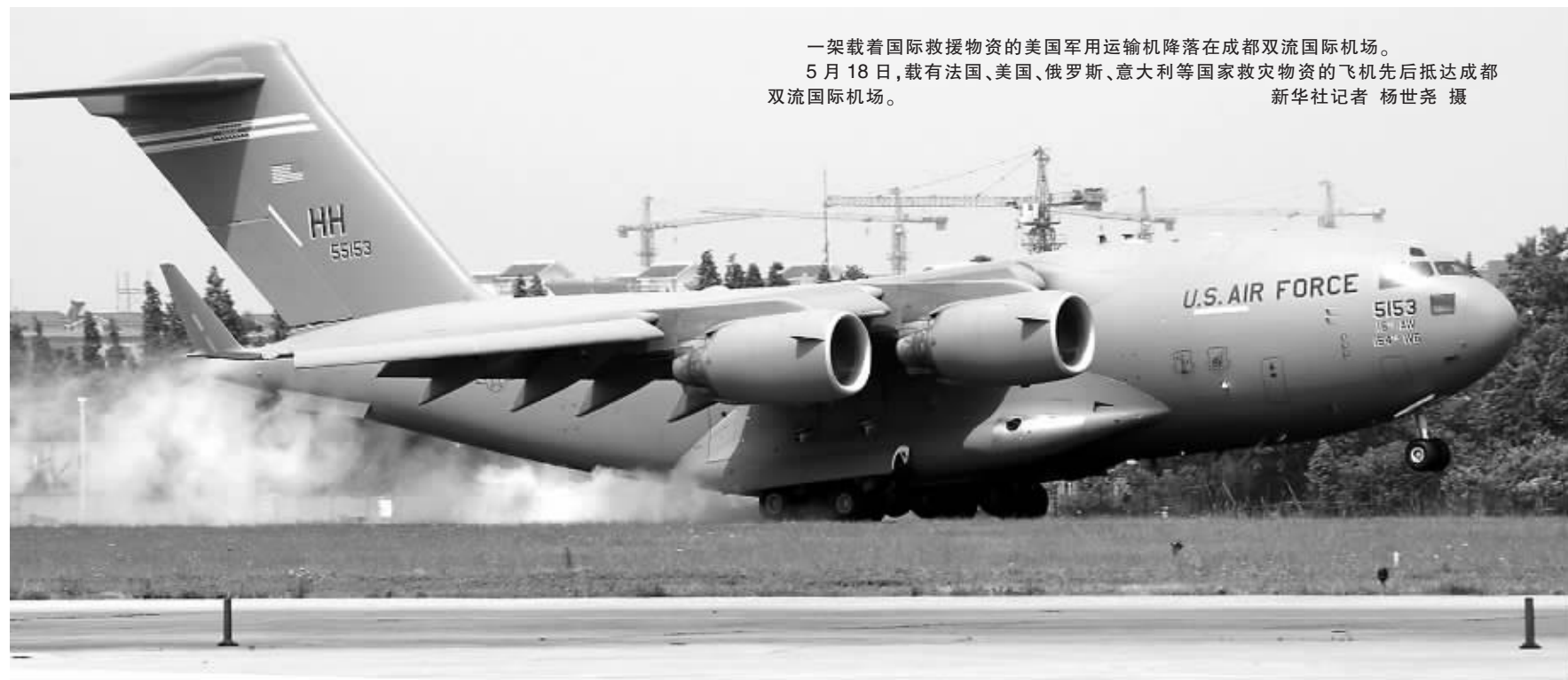
一架载有国际救援物资的美国军用运输机降落在成都双流国际机场。5月18日,载有法国、美国、俄罗斯、意大利等国家救灾物资的飞机先后抵达成都双流国际机场。新华社记者 杨世尧 摄

伊朗外交部日前表示,伊朗红新月会将向中方提供包括帐篷、药品和防水垫等在内的62.4吨物资援助。在19日的启运仪式上得知中国地震灾区急需帐篷等物资后,阿加纳尔当场承诺把计划捐赠的帐篷数量从700顶增加到3000顶,从而使援助物资增加到约150吨。