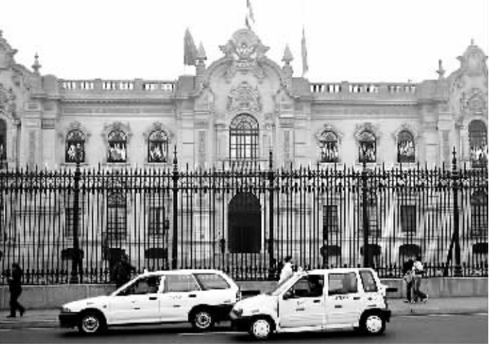
五月十九日,秘鲁首都利马的总统府降半旗向中国四川汶川大地震遇难者志哀。

者遗体肃立默哀,这样的场景在中国人民之间广为流传。“我们向他们的人道主义精神和对中国人民的友好感情致敬!”秦刚说。秦刚还表示,继救援队之后,日方医疗队也将到中国地震灾区开展抢救伤员的工作。相信他们能够像救援队一样,本着高昂的斗志、崇高的精神以及对中国人民的友好感情,投入到抢救伤员的工作中。中方愿意和日方医疗人员保持密切配合,共同做好伤员的医护、医治工作。