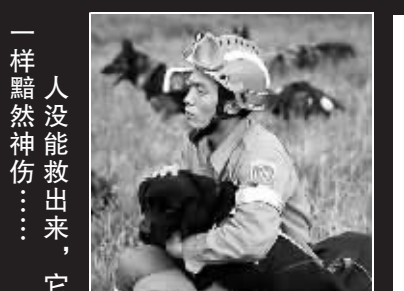
一样黯然神伤……它和主人

平时训练搜救犬，都以活人隐藏为目标，要求犬在搜索到人时，吠叫报警提示。这次，它第一次遇到死人，狗狗是有灵性的，它感觉到了，它找到的是死了的人，它也哭了。