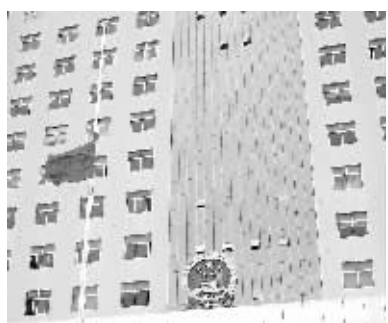
5月19日14时28分，海南省人民检察院全体检察干警为四川汶川地震的遇难者默哀3分钟。