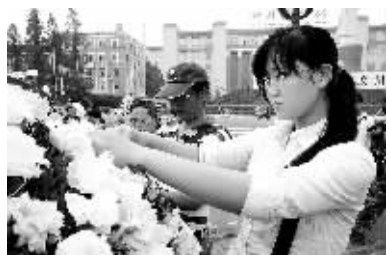
5月20日，成都市一名女青年在松枝上别白花，向在汶川大地震中遇难的同胞和亲人志哀。

套题照片：5月20日，在济南市解放路第一小学，一名同学为汶川大地震遇难同胞祈祷。