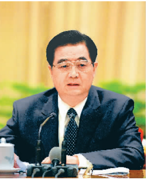
6月13日,中共中央、国务院在北京召开省区市和中央部门主要负责同志会议。胡锦涛总书记在会上发表重要讲话。

会议指出,当前抗震救灾形势依然严峻、任务十分繁重。要坚持以人为本,继续全力以赴做好救治伤员、安置受灾群众、加强卫生防疫、防范次生灾害、抢修基础设施等方面的工作,并在这个基础上,尽快开展灾后恢复重建工作。