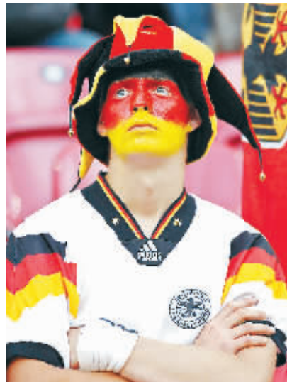
输给克罗地亚队,德国球迷赛后露出失望。

今天两翼发挥得不错,压迫住了对手,给德国队造成了很多困难。我对所有的球员都非常满意,否则我们不可能击败德国队这样强大的对手。”