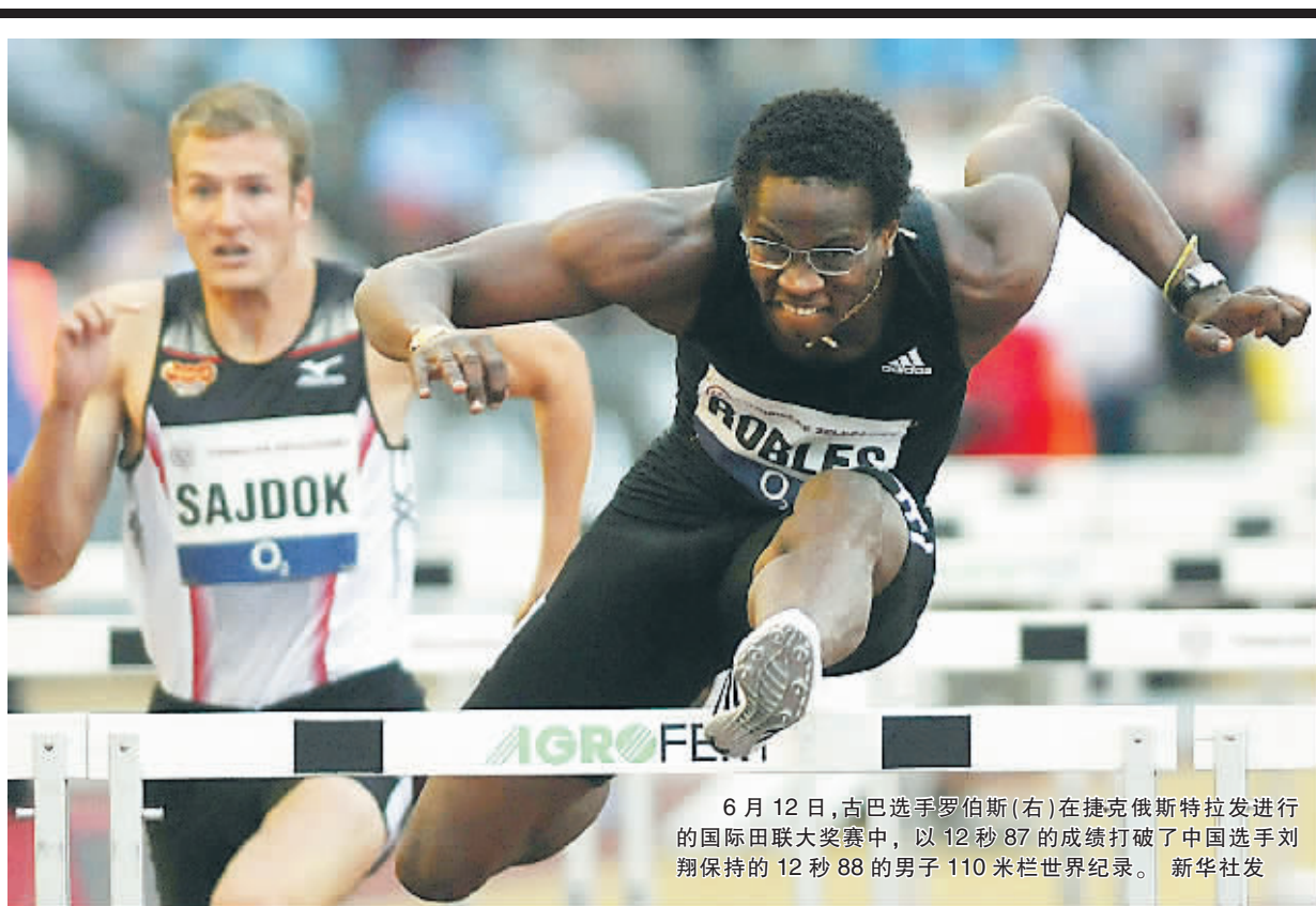
6月12日,古巴选手罗伯斯(右)在捷克布拉格举行的国际田联大奖赛中,以12秒87的成绩打破了中国选手刘翔保持的12秒88的男子110米栏世界纪录。

134 中国移动号码段大家族 135 136 137 138 139 159 158 150 151