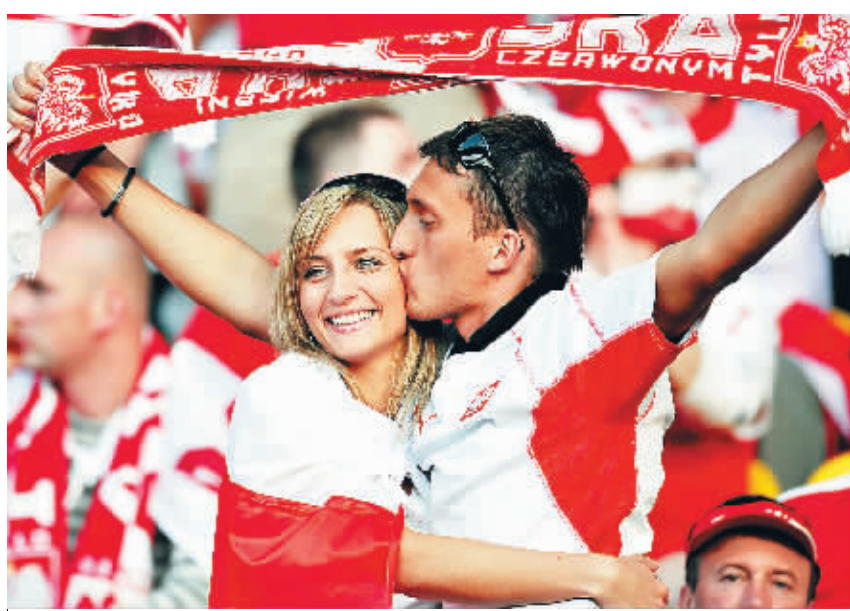
6月12日,一对球迷恋人在等待比赛开始。在维也纳举行的B组比赛中,奥地利队1:1平波兰队。在另一场比赛中,克罗地亚队2:1战胜德国。