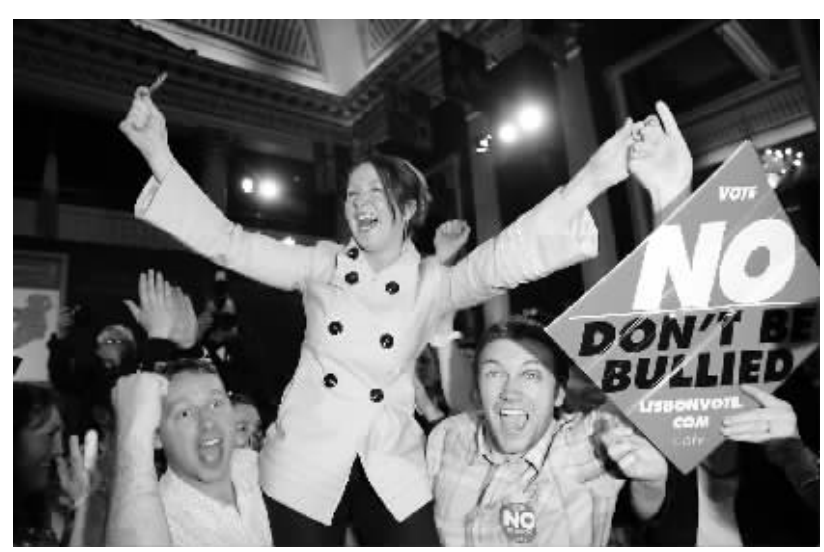
13日,在爱尔兰首都人们高举标语庆祝《里斯本条约》被否决。

13日下午,爱尔兰全民公决否决了《里斯本条约》,从而使欧盟一体化进程再次陷入困境。尽管爱尔兰上至政府下至工会都大力支持《里斯本条约》,并在过去数月发起了各种宣传动员活动,帮助公众了解条约内容,但由于公众普遍对投票冷漠,对条约内容及含义缺乏真正了解,使得投票率未能达到最低预期,大大影响了投票结果。