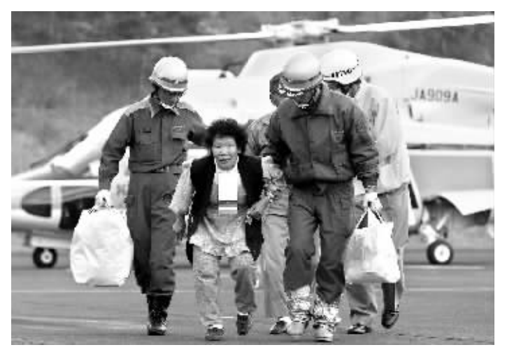
6月14日,在日本北部的宫城县栗原市,救援人员护送一名从被困地带疏散出来的老人离开直升飞机。

自卫队出动 共同社报道,地震发生约7分钟后,日本政府在首相官邸的危机管理中心设置“官邸对策室”,并决定向震中地区派出以防灾担当大臣泉信也为首的调查团。