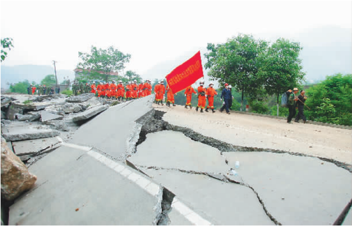
海南救援队中，党员是中坚力量。

各级党组织纷纷以实际行动支援灾区。灾情一发生，5 月 13 日省委组织部积极响应省委号召，紧急行动，组织机关全体党员干部向四川灾区捐款 30975 元，并以最快的速度将捐款送达四川省委组织部。省食品药品监督管理局党组向全省医药行业近 70 家企业募集价值 1100 多万元急需药品急送灾区。省商务厅党组组织我省“双百市场工程”试点企业及商贸流通重点企业，紧急向四川灾区捐赠 250 吨新鲜瓜果。海航集团党委启动应急预案，要求集团旗下 13 家航空公司的 150 余架飞机运力 and 3000 余名机组人员全部处于抗震救灾待命状态，不计成本、倾尽全力投入抗震救灾工作，全力保障救灾人员和物资免费运送。目前，海航集团已执行抗震救灾航班 98 班，