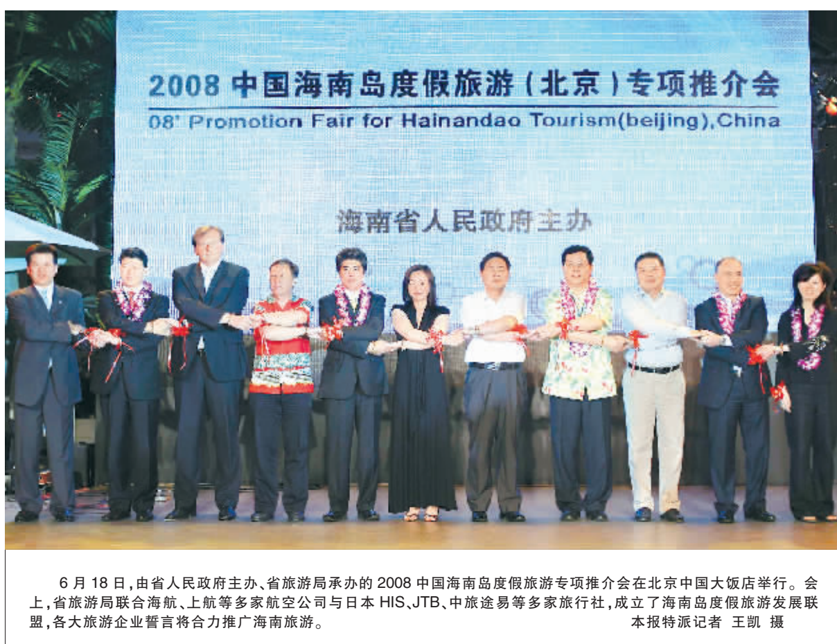
6月18日,由省人民政府主办、省旅游局承办的2008中国海南岛度假旅游专项推介会在北京中国大饭店举行。会上,省旅游局联合海航、上航等多家航空公司与日本HIS、JTB、中旅途易等多家旅行社,成立了海南岛度假旅游发展联盟,各大旅游企业誓言将合力推广海南旅游。

本报北京6月18日电(记者单崇岗 王凯 通讯员包丽溪) 随着激动人心的北京奥运会日益临近,作为中国独一无二的热带海岛度假省份,海南正在积极备战,尽可能争取最大份额的奥运旅游蛋糕。今天上午,以“奥运在北京 度假在海南”为主题,由省人民政府主办、省旅游局承办的2008中国海南岛度假旅游专项推介会在北京中国大饭店举行。 副省长陈成在会上做了重点推介。他指出,在党中央、国务院的鼎力支持下,海南正在全力建设国际旅游岛,并以此为载体提升旅游业的对外开放水平。作为我国最大的经济特区和我国唯一的省级经济特区,海南将在原有航权开放政策、免签证政策和落地签证政策等旅游优惠政策的基础上,享受国家给予的更加优惠的旅游开发开放政策。海南将把北京奥运和海南度假旅游相结合,着力推广海南结合奥运主题新设计的一系列旅游线路及旅游产品。他表示,海南未来旅游发展的前途无量,旅游开发潜力巨大,创业商机无限,欢迎各界人士来海南旅游度假,投资兴业。 推介会共安排了度假天堂、海南情结以及奥运献礼三个主题内容。 “度假天堂”环节重点推介了海南下半年即将举办的三项主要活动:一是举办大新华航空LPGA高尔夫赛,即美国女子职业高尔夫巡回赛,这是女子职业高尔夫界的一项重大赛事,将由大新华航空冠名赞助,并将于10月24日在海口举行,这是LPGA进入中国的首次比赛,备受国内外关注。二是举办第25届2008Elite世界精英