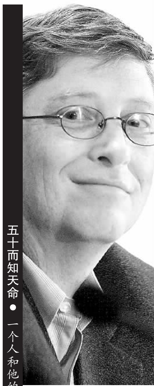
五十而知天命 ● 一个人和他的两个世纪