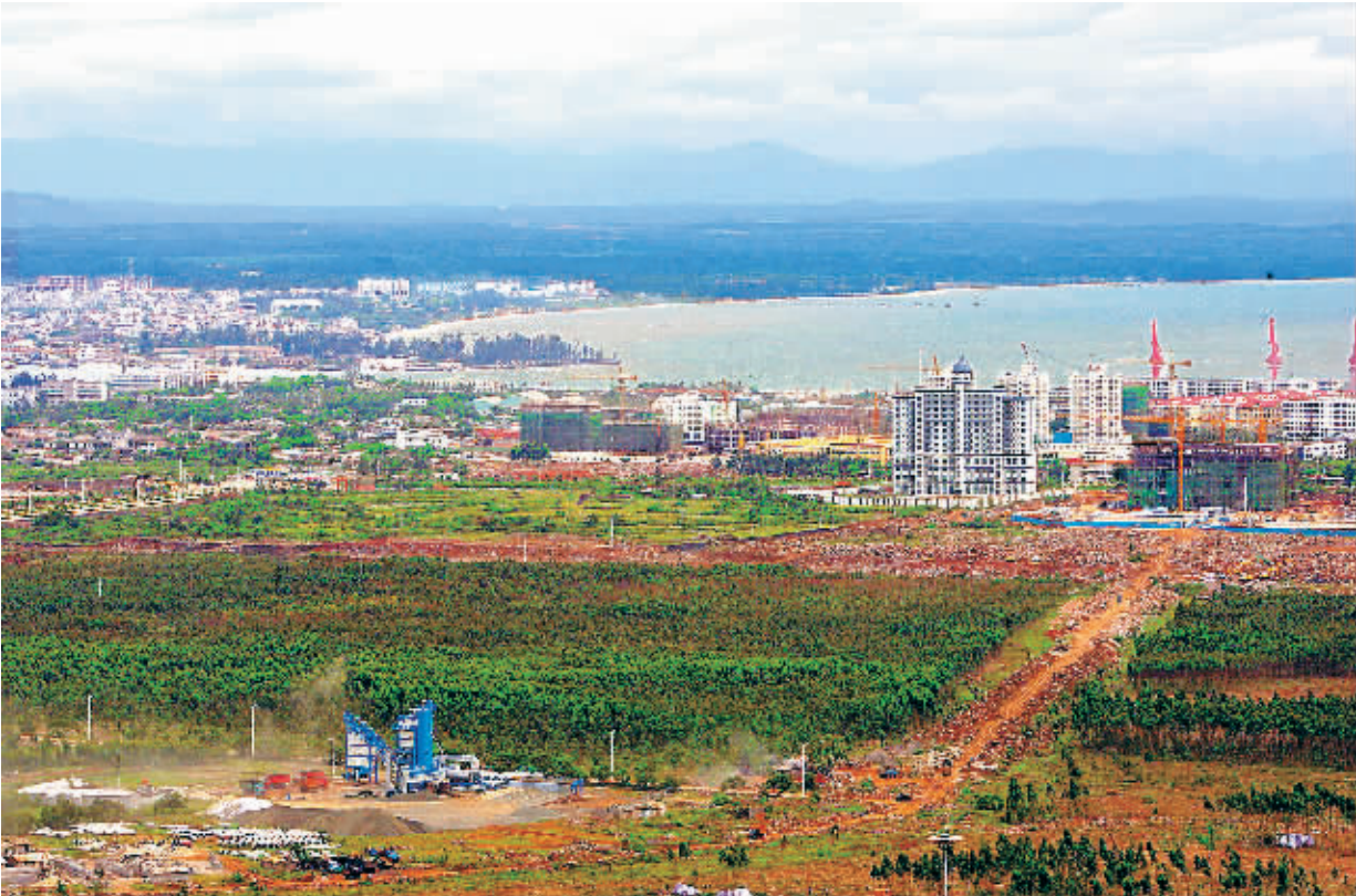
打造洋浦海口一小时交通圈,对正处于开发中的洋浦将影响深远。图为洋浦保税港区俯瞰。