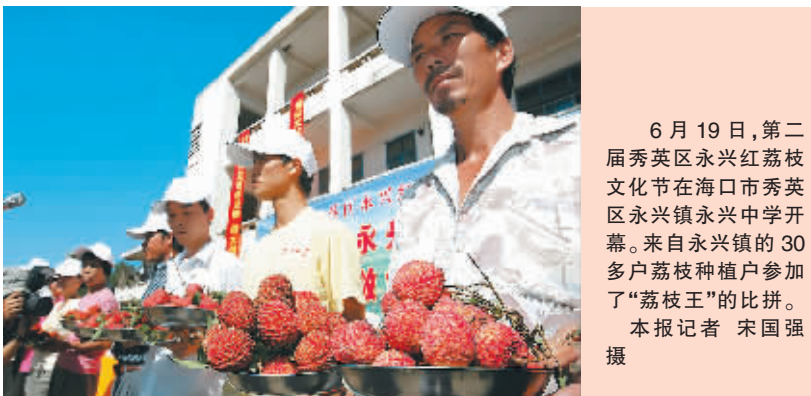
6月19日,第二届秀英区永兴红荔枝文化节在海口市秀英区永兴镇永兴中学开幕。来自永兴镇的30多户荔枝种植户参加了“荔枝王”的比拼。

在荔枝文化节上，永兴镇的30多个果农拿来自己种出的荔枝果，参加了大丁香荔枝、紫娘喜荔枝、无核荔枝等3个项目的比赛。据了解，今年永兴的荔枝较为丰收，产量较高而且价格看好，目前普通品种价格在每斤四五元左右，而新球蜜荔以及南岛无核等优质品种价格达每斤12元—15元。