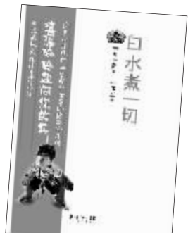
白水煮一切 长江文艺出版社 2008年5月

张伟早在14岁读初中三年级时就组建了花儿乐队，并在当年一举成为摇滚乐团中风头最劲的乐队，被北京的娱乐媒体称作“中国第一支未成年乐队”以及“天才少年乐队”，并一度被视为“世纪末华人乐坛的奇迹”。张伟也因此博得“天才少年”的美誉。也是在1998年他初中毕业后考