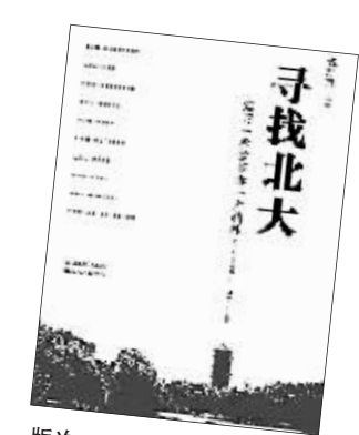
版次：2008年3月第1版 中国长安出版社

1998年，北大百周年校庆前夕，钱理群曾发表著名文章《想起七十六年前的纪念》，提醒人们要注意北大“兼容并包、思想自由”精神的失落。