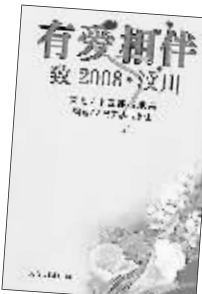
中宣部出版局策划 人民文学出版社出版

这是一本感人至深的诗集，连编辑都是留着泪完成组稿：《有爱相伴——致2008·汶川》，在5·12地震过去仅仅14天以后，这本由中宣部出版局策划的诗集问世。诗集分为“哀痛：生死不离”、“挺住：有爱相伴”和“感动：有一个强大的祖国”三部分，皆选自汶川地震之后一周内公开见诸全国各媒体的诗歌作品，包含了大量的英雄精神和大爱情怀。