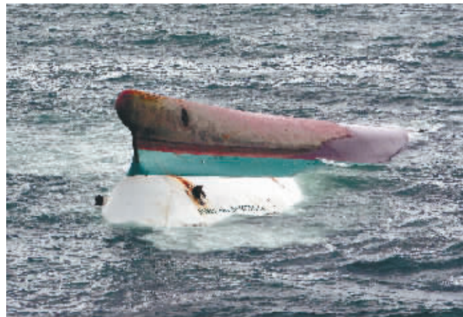
“群星公主”号渡轮局部浮出水面

中国驻菲大使馆发言人彭修彬23日告诉新华社记者,目前尚无中国人在翻船事件中伤亡的消息。