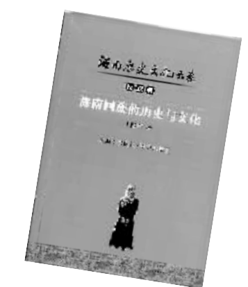
海南出版社 南方出版社 联合出版

其二，该书研究方法很有特色，是历史学与民族学方法相结合的产物。作者从2002年开始接触海南回族以来，就一直持续不断地对海南回族进行了长时间的追踪研究，期间在海南回族聚居的回辉村和回新村进行了多达十余次的田野调查，广泛地收集了有关海南回族