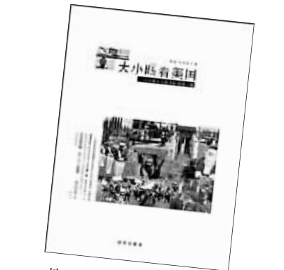
摘自《大小眼看美国》 新华出版社

况下，退回的一点钱可能只够付来来回回的汽油费，稍有经济头脑的人是不会这么干的。但我是个记者，就想看看美国商家是否说到做到。