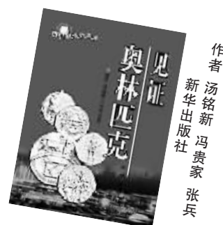
作者 汤铭新 冯贵家 张兵 新华出版社

通过我驻世界各国外交官对我国登上奥林匹克舞台、驰骋奥运赛场、申奥成功等一系列历史亲历的回顾，展示了在中国体育事业的发展过程中，国家领导人、外交界为之奋战的动人情景及国际体育高官和海内外华人支持的感人事迹。