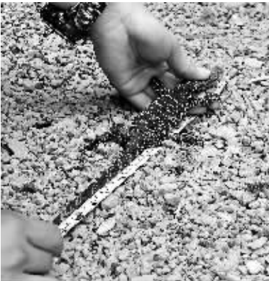
放生前,专家在测量圆鼻巨蜥的长度。

昨天下午,陈肇乐在仔细查看了 6 条小巨蜥的健康状况后,发现其中两条小巨蜥鼻部轻微受伤,另外 4 条健康状况良好,