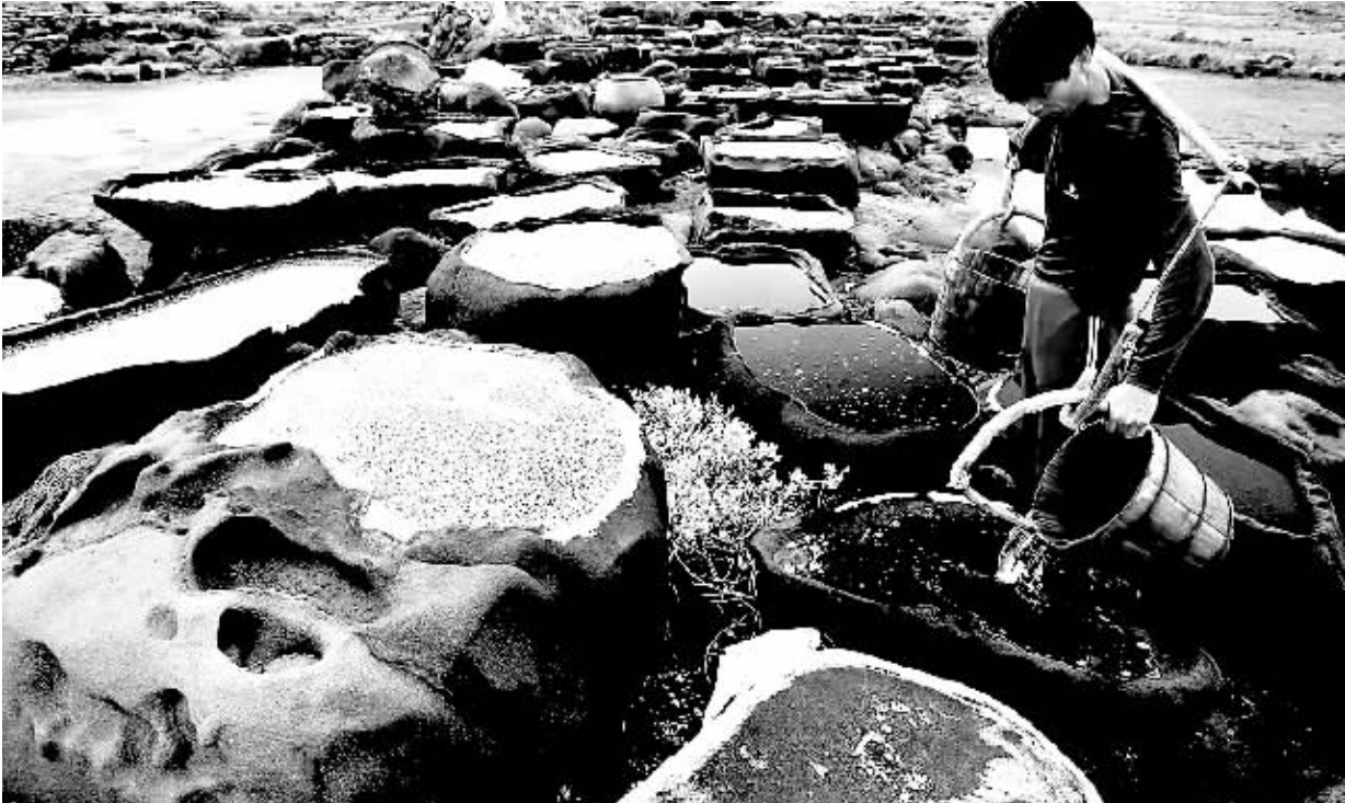
如今在洋浦盐田村,晒盐的年轻人已经不多了。

洋浦盐田位于海南省西北部的儋州洋浦半岛西南处,濒临新英湾。现今保存了 700 多亩的盐田,7300 多个石槽、晒盐泥地、盐泥池、盐卤水池各约八九十个,蓄海水池约六七十个。 洋浦盐田的传统日晒制盐工艺属板晒法,其主要工序过程是利用海水涨潮时淹没蓄海水池,存蓄海水和浸泡晒盐泥地(盐田)里的泥沙。退潮后将海水淹没过的泥沙翻耙曝晒两三天至干,再铺垫干茅草,夯填入堆筑起来的过滤池(盐泥池),接着把蓄海水池中的海水倒入过滤池,湮浸池中泥沙,海水慢慢渗透到盐泥池底,透过石缝,积流入旁边低干地面的盐卤水池。次天上午再将积蓄到一定多并沉淀澄清的盐卤水直接浇灌到浅浅的石槽里,曝晒一大半天,下午即可结成盐巴。 洋浦盐田也是我国目前保存比较好的古盐场,其所沿用至今的古老传统制盐工艺是中华民族民间传统制盐手工业发展的历史见证。