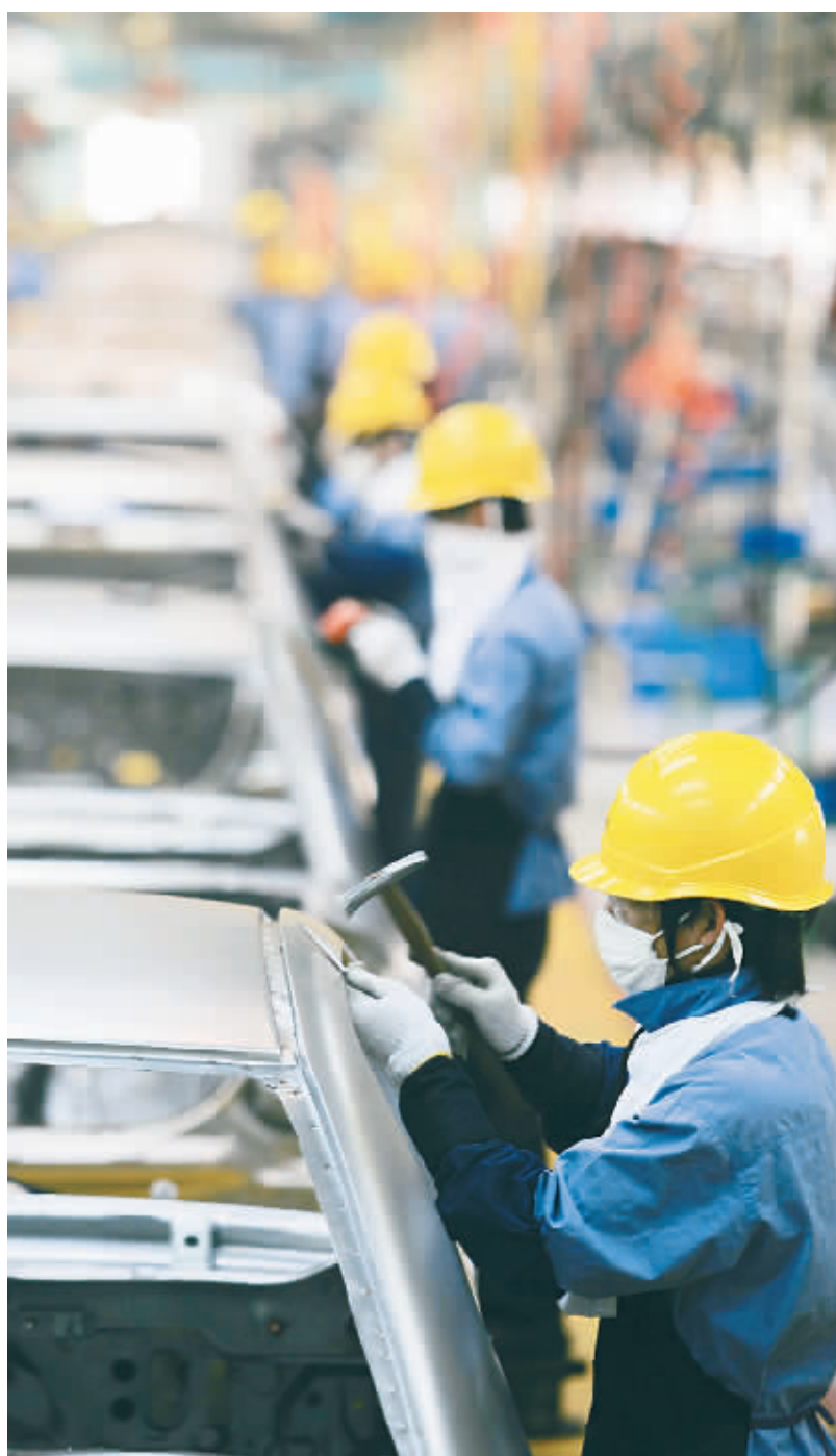
图为海马汽车焊装生产线,工人们正在生产线上紧张忙碌着。