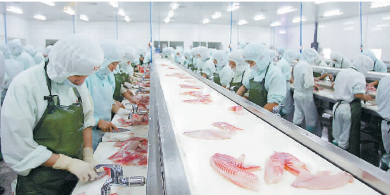
值得欣慰的是，我省海水产品出口在不利形势下还能保持强劲增长。