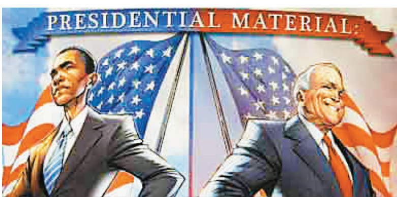
漫画：奥巴马(图左)与麦凯恩(图右)