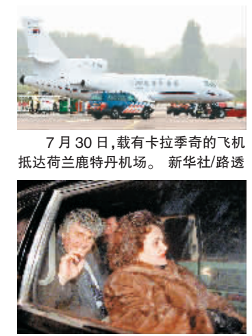
7月30日，载有卡拉季奇的飞机抵达荷兰鹿特丹机场。

载卡拉季奇的车队于30日3时45分(北京时间30日9时45分)离开贝尔格莱德战犯法庭，前往贝尔格莱德国际机场。4时15分左右，一架商用飞机从机场起飞，据悉卡拉季奇就在这架飞机上。塞尔维亚政府30日凌晨发表声明说，政府已发布命令允许引渡卡拉季奇。另据塞尔维亚塔斯社通讯社报道，引渡卡拉季奇的决定是由塞司法部长斯内扎娜·马洛维奇依据塞政府与前南刑庭合作的法律签署的。