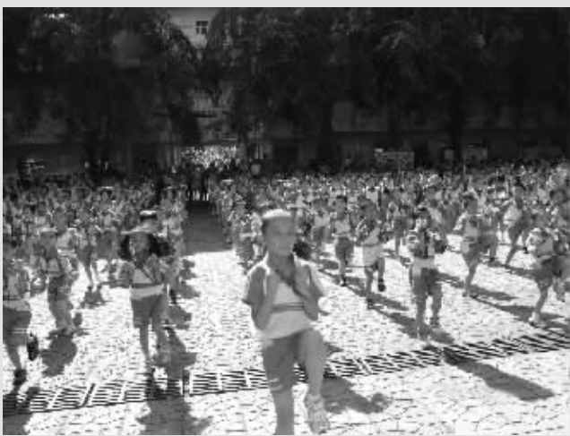
▲一年一度的英语节上孩子们投入表演