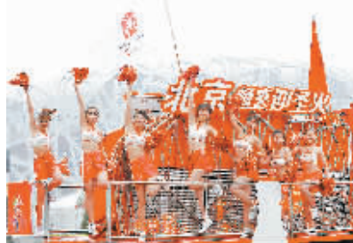
8月4日,拉拉队员在国家体育场附近的花车上排练,准备迎接奥运圣火北京传递活动。8月6日至8日,奥运圣火将在北京传递。