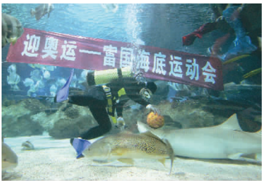
8月4日,在北京一家海底世界动物公园,潜水员当裁判,小鲨鱼们正在进行“顶球”项目比赛。这是该公园在奥运会期间,专门举办的“迎奥运”主题海底运动会。该公园旨在通过如此活动,在奥运期间,向中外客人展示中国的海洋文化。

选了跆拳道选手黄志雄。其他候选人中有大名鼎鼎的澳大利亚游泳选手哈卡特,比利时女子网球选手海宁,法国网球选手莫雷斯莫,俄罗斯游泳选手波波夫,古巴女排的小路易斯等。