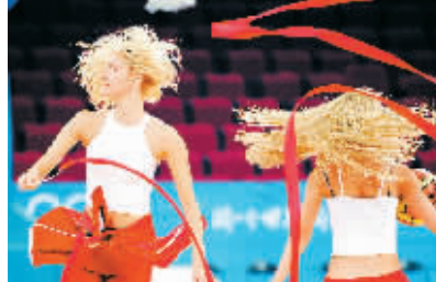
8月4日,来自乌克兰的北京梦幻之舞拉拉队员在北京奥林匹克篮球馆进行排练。