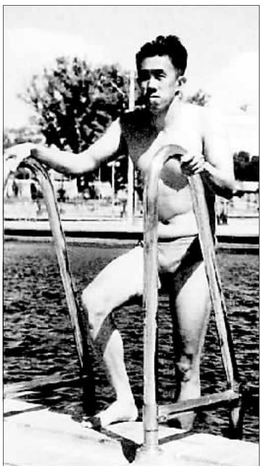
→新中国第一个参加奥运游泳比赛的运动员吴传玉。