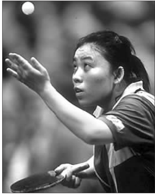
←奥运会金牌最多的运动员——邓亚萍。邓亚萍蝉联1992年第25届奥运会和1996年第26届奥运会女单、女双冠军,成为中国奥运史上唯一蝉联奥运会乒乓球金牌的运动员,并获得4枚奥运会金牌,其中包括单打和与乔红组合的双打。