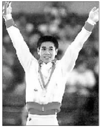
↑李宁在1984年洛杉矶奥运会上,一共夺取了3金2银1铜6块奖牌。是在奥运会上获得奖牌最多的运动员。