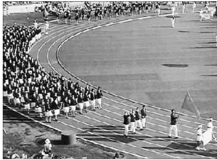
↑1984年,中国代表团重返奥运大家庭后首次参加奥运会。图为中国代表团参加洛杉矶奥运会入场时的场面。