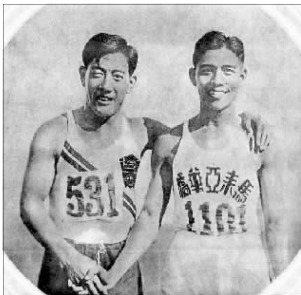
↑第一个参加奥运会的中国人刘长春(左)。

1936年柏林奥运会后,由于第二次世界大战,现代奥运会为此中断了12年。1948年,第14届奥运会