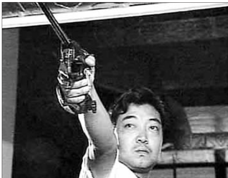
↑为中国夺得奥运第一金的人许海峰。