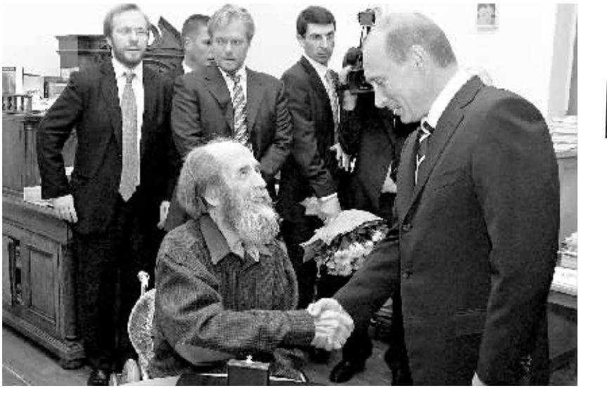
2007年6月12日,索尔仁尼琴在家中与时任总统的普京握手。

写道,“国家长出劳改营和流放制度怎能活下去?” 索尔仁尼琴1956年摆脱全部罪名,恢复自由身。与此同时,他的癌症痊愈。 索尔仁尼琴1961年成为苏联作家协会成员。他次年凭借《伊万·杰尼索维奇的一天》一夜成名。 “古拉格” 索尔仁尼琴的政治和文学春天并未持续太久。随着列昂尼德·勃列日涅夫1964年接替赫鲁晓夫,索尔仁尼琴揭秘式的文学作品成为前情报机克格勃的重点“盯防对象”。 瑞典文学院1970年把诺贝尔文学奖授予索尔仁尼琴。文学院说,他在“追随俄罗斯文学不可或缺的传统”过程中展现了自己的道德力量。苏联当局禁止索尔仁尼琴前往瑞典领奖。 尽管克格勃竭力阻挠,索尔仁尼琴的