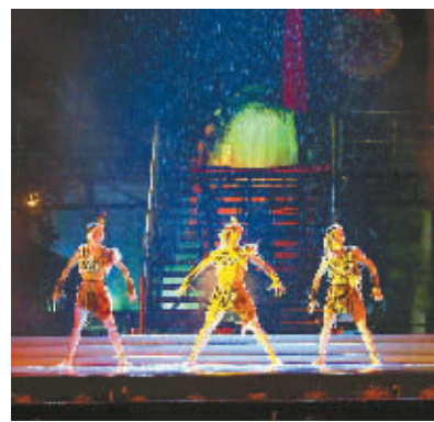
8月6日晚,嬉水节大型文艺晚会在保亭七仙广场举行。