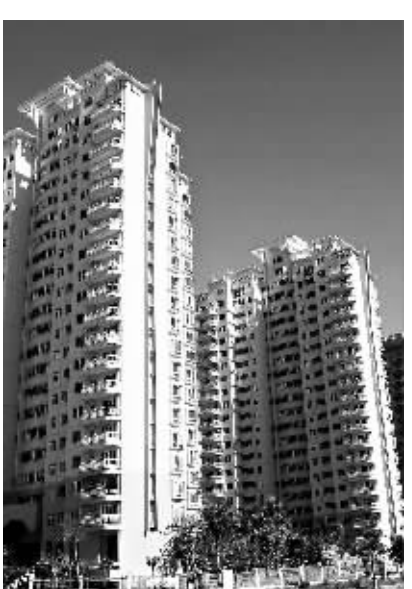
在经过一段时期的房价较快上涨之后,我国房地产市场开始向理性回归。

据统计,今年1-5月,40个重点城市新建商品房、二手房累计成交面积同比分别下降24.9%、20.9%。而上半年全国70个大中城市房屋销售价格同比和环比涨幅均呈下降走势。为了抑制投机性需求,自去年下半年以来,央行、银监会出台了多次加息和提高