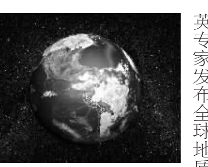
英专家发布全球地质电子图 英国地理学专家8月6日发布一款全球地质情况电子地图。发布者说,这是世界首款类似地图,能指导人们勘探和开采油气资源和寻找掩埋温室气体的合适地点,提醒人们注意地震和泥石流等自然灾害易发地带等。这款电子地质图汇集83个国家和地区地质中心的现有数据,标记全球各地植被、水、土壤和人类建筑群等不同地质带。这是8月6日发布的地图。