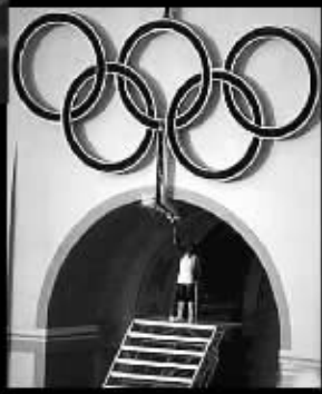
1984洛杉矶“太空人”点火