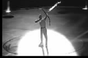
1992巴塞罗那射箭点火