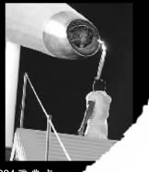
2004雅典点火返璞归真