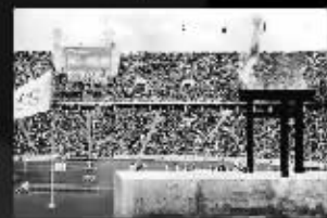
1936柏林首次采用火炬接力