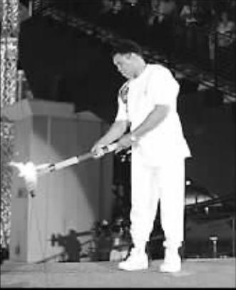
1996亚特兰大老阿里颤抖的一点