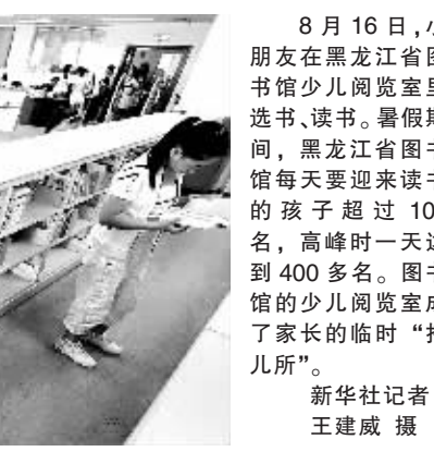
8月16日,小朋友在黑龙江省图书馆少儿阅览室里看书、读书。暑假期间,黑龙江省图书馆每天迎来读书的孩子超过100名,高峰时一天达到400多名。图书馆的少儿阅览室成了家长的临时“托儿所”。

据新华社广东惠东8月16日电 (记者孔博)记者赶赴现场核查证实,15日发生在广东省惠东县一家鞋厂的火灾,共造成6人死亡、6人受伤。伤者目前均无生命危险,当地政府及时开展了相关善后工作,火灾原因仍在调查当中。 据惠东县黄埠镇政府介绍,发生火灾的是黄埠镇龟山洋工业区的欣盛鞋业作坊。火灾发生于15日凌晨3时5分,5时46分大火被扑灭。发生火灾的作坊为一栋四层楼房,占地面积约160平方米,过火面积约200平方米。