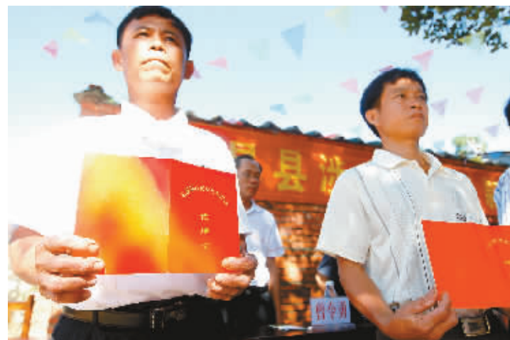
如期还款的农户,领到了屯昌县政府发放的信用证。

本报屯城8月18日电(记者于伟慧 通讯员王先)在屯昌县西昌镇令坡村头,高高地挂着一块“屯昌县涉农贷款信用村”的金色牌匾,涉农贷款按时还款使令坡村获此殊荣。