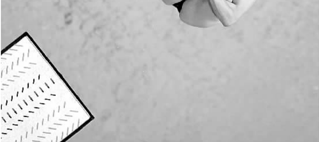
俄罗斯选手帕卡琳娜在北京奥运会跳水女子3米跳板决赛中的英姿。