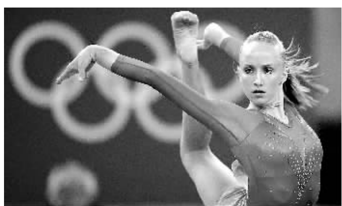
俄罗斯选手帕卡琳娜在北京奥运会跳水女子3米跳板决赛中的英姿。