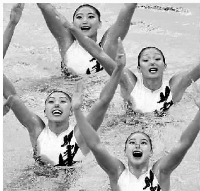
中国队花样游泳队在表演。

海南金菜商务酒店温馨提示 看奥运 休息好 奥运客房 188 元/晚 赠早餐和啤酒等八项服务 订房热线:0898-36681111 网址:www.3668111.com