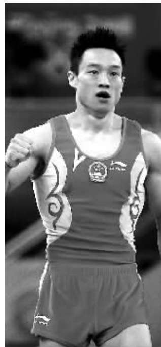
杨威还想征战下届奥运会。

据新华社北京 8 月 22 日电 (记者李丽 高鹏)中国体操队以 9 金辉煌结束北京奥运会后，杨威、李小鹏等老队员将何去何从？他们似乎还没有清晰的计划。