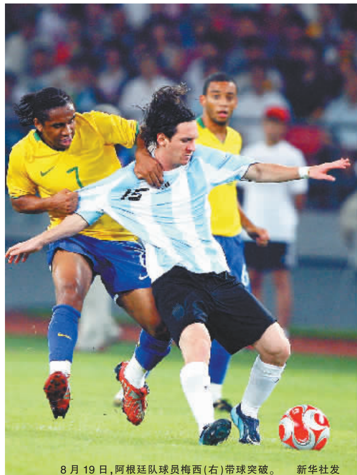
8月19日,阿根廷队球员梅西(右)带球突破。

阿根廷队与尼日利亚队之间的实力差距并不大,阿根廷队或许稍占上风。但是,这种一场定胜负的奥运会决赛意味着很大的偶然性,一名球员的灵光一现就可能决定比赛的胜负与冠军的归属。