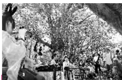
9月14日上午,游客们在南山文化旅游景区的百年酸豆古树下,一边游玩一边欣赏音乐。