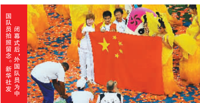
闭幕式后,外国队员为中国代表团拍照留念。

据新华社北京9月17日电 17日,北京残奥会落下帷幕。中国体育代表团的332名运动员参加了全部20个大项的比赛,一共获得金牌89枚,银牌70枚,铜牌52枚,奖牌总数达到211枚,位列金牌榜、奖牌榜双第一。