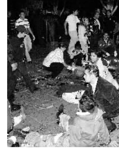
15日,墨西哥米却肯州首府莫雷利亚市中心广场发生爆炸事件。