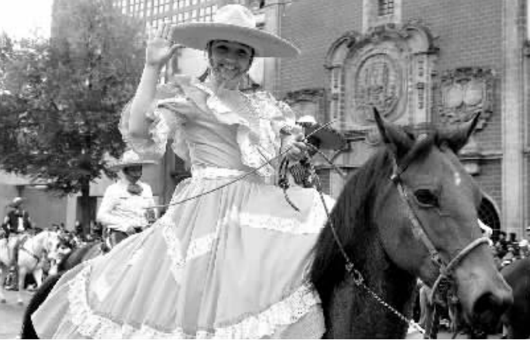
16日,在墨西哥首都墨西哥城街头,一名女骑手身着盛装。当日,墨西哥城的宪法广场举行阅兵式,庆祝墨西哥第198个独立日。

墨西哥米却肯州首府莫雷利亚市15日晚遭遇恐怖袭击,有人向庆祝墨西哥独立日活动的人群投掷手榴弹,造成至少8人死亡,100多人受伤。