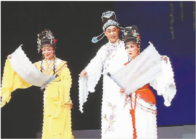
《团圆探花府》剧照。

近日，阿娇低调去往地震灾区北川，在那里做义工、陪灾民群众度过中秋节，诸般善举为这位“艳照门”女主角的正面形象加分不少。看到效果显著，英皇方面打算再接再厉，派阿娇继续为四川灾区多做善事。日前，返港的阿娇拿着纸袋，在英皇大厦上下走了一遍，挨个找人募捐。 向媒体报料的正是阿娇的经纪人霍汶希，她透露，阿娇这几天都到公司筹款，“因为她知道冬天快到了，四川灾区会很冷，所以希望筹钱买些御寒衣物送过去。”据说，当时英皇大厦里有不少员工都没认出阿娇来，还有人问她是哪个部门的，甚至有一位员工慷慨地捐了100美元，不过对方却将她误为阿Sa，对此阿娇显得很大度，“这100美元我代阿Sa多谢你。我是阿娇，你可以为我再捐100美元吗？”就这样，对方又捐出了100美元。 9月20日下午，记者致电霍汶希，询问阿娇的筹款情况，以及何时会再来四川。在电话里，霍汶希告诉记者：“阿娇一共筹到12万港币，随后会拿这笔钱去添置一批冬天穿的厚衣服。”同时她也向记者确认，阿娇已决定亲自带这批衣服再来四川，“不过具体时间现在还未确定，大约在11月吧，总之肯定会赶在天气变冷前去的。” 关于阿娇何时复出的问题，霍汶希则表示，年底阿娇可能会在香港出席一些慈善活动，同时也有可能接拍新的影视剧，“不过具体细节都未确定。”（乔雪阳）